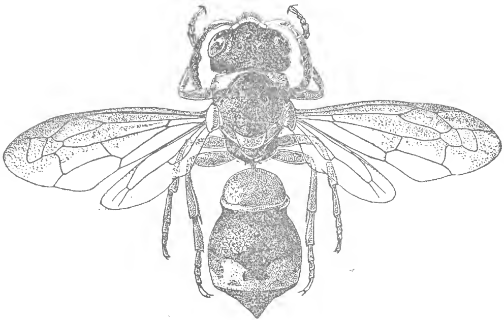
FIG. 3. — Leptochilus ( Euleptochilus ) atlanticus Blüthgen, n. sp.

Noir ; une large bande au pronotum, de grandes taches aux méso-pleures, les parategulæ, une bande apicale courbe du scutellum ; les 2/3 inférieurs de la face postérieure du postscutellum, une large bande du 2 e tergite échancrée par devant au milieu, une tache transversale du 3 e tergite et une bande du 2 e tergite, jaune doré, un peu orangé au contour des dessins ; bourrelet apical du 1 er tergite et jaune clair ; elyptés,